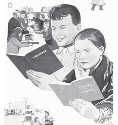
Книга – наш верный помощник в поисках истинного пути и культурно-здорового колоритной жизни.

ХОРОШУЮ БИБЛИОТЕКУ – НАЙДЕМУ СОВЕТСКОМУ СЕЛУ!