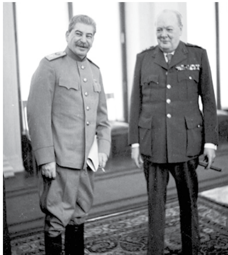
Сталин и Черчилль на Ялтинской Конференции