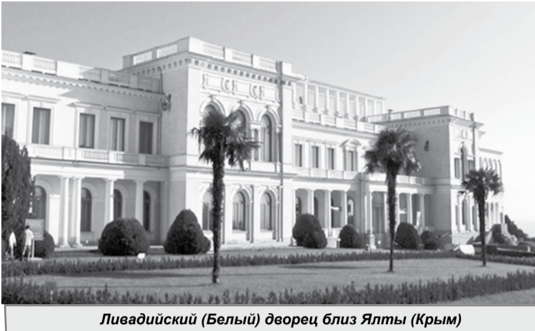
Ливадийский (Белый) дворец близ Ялты (Крым)

В год 70-летия Победы советского народа над фашистской Германией в Великой Отечественной войне 1941-1945 годов редакция продолжает публикацию статей, посвящённых этой знаменательной дате.