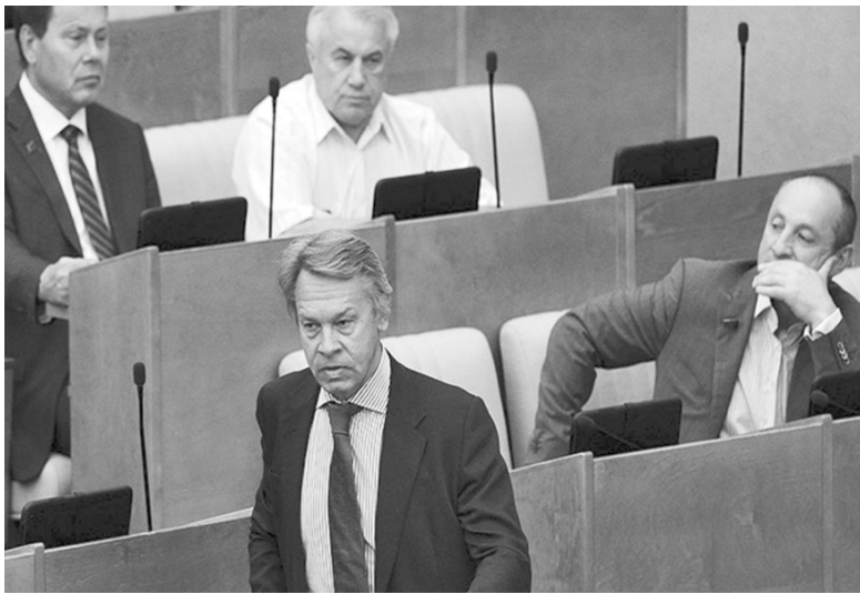
стоятельства. Но нам о них ничего не известно.

Хотя, оно конечно, может они там и есть: какие-то особые об-