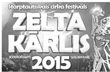
ции, Швейцарии, Финляндии, Италии, Мексики и США.

Цирковые артисты показывали международному жюри номера в различных жанрах. Всего более 50 номеров продемонстрировали артисты из 15 стран - Беларуси, России, Украины, Молдовы, Узбекистана, Латвии, Литвы, Польши, Германии, Шве-