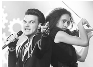
нал «Беларусь 24».

пройдет в Вене (Австрия) с 19 по 23 мая. Прямую трансляцию двух полуфиналов и финала традиционно будут вести телеканалы Белтелерадиокомпания - «Беларусь 1» и международный спутниковый телека-