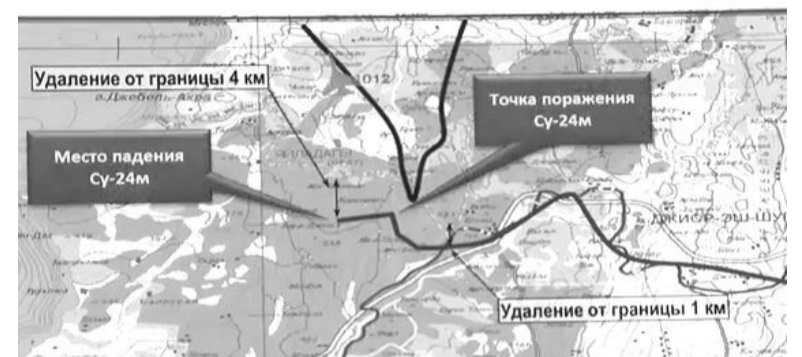
Схема поражения самолета Су-24М ВКС ВС РФ

рии Алеппо. Правительственная армия движется ко второму по величине в стране курдскому анклав в Африне и курдско-шитским предместьям Алеппо в квартале Шейх-Максуд, а также городах Нубль и Аль-Захра. Выход на эти территории, помимо изменения всей стратегической конфигурации на севере страны, даст лоялистам большой приток людских резервов, в которых они очень нуждаются. В Пальмире сирийская армия приблизилась не просто к своему «Сталинграду», замыкая кольцо вокруг серьезной группировки ИГ, но и в случае последующего прорыва на Дейр-эз-Зор – к «Курской дуге». Успех здесь, согласно эффекту домино, может позволить вернуть под контроль Дамаска в самые сжатые сроки практически до половины всей территории, захваченной группировкой ИГ в Сирии. Понятно, что это чрезвычайно волнует не только самих исламистов, но и некоторых «борцов» с ними, рассматривающих на самом деле террористов как инструмент своей политики.