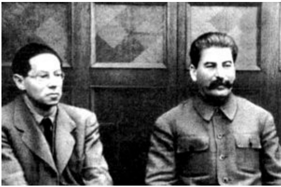
8 января 1937 года состоялась беседа И. В. Сталина с германским писателем Лионом Фейтсвангером. Поразительно похожи многие вопросы, заданные почти 80 лет назад с теми, которые современники задают друг другу