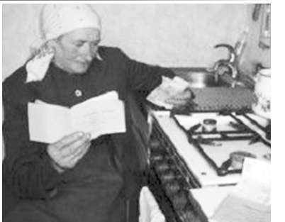
«Горилл», повторилось в Украине. Хотели в Европу - попали в Гондурас.

Замминистра внутренних дел - оттуда же. Налицо самый настоящий оккупационный режим, который украинцы посадили себе на шею сами. Нет никаких оснований считать, что в будущем году он изменится и перестанет врать и гнать людей на убой. Это просто новая БАНДА. Порядочный человек не имеет права служить этой клике кровавых клептоманов. То, что Соединенные Штаты десятилетиями проделывали для Южной Америки, сажая в диктаторское кресло