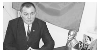
Коммунистической партии Украины и восстановить ее законную Конституционную деятельность в полном объеме и безопасных условиях.

Коммунисты Казахстана дорожат дружбой с Украиной и во имя продолжения этой дружбы, во имя наших будущих поколений требуют прекращения преследования и гонений на коммунистов Украины, а также отменить все судебные процессы по запрету деятельности