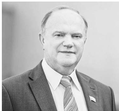
многие потеряли свои сбережения...» — подчеркнул лидер КПРФ.

проблему работы кабинета министров». По его словам, ряд российских министров работает блестяще, в частности, главы МИД, МВД, Минобороны. «Но если в целом посмотреть на то, что они делают с бюджетом, доходной, расходной частями; финансово-экономической, аграрной и социальной блоками — там полный провал. Поэтому надо садиться и определять, что и как. Мы подошли к 2015 году ослабленными, наш рубль просел за последнее время вдвое,