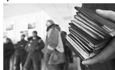
денежных переводов гастарбайтеров. К таким выводам пришли эксперты Всемирного банка. По данным банка, доля денежных переводов составляет четверть Внутреннего валового продукта. Первые позиции в рейтинге занимают Таджикистан — 42 процента, Кыргызстан и Непал — 32 и 29 процентов соответственно. Чуть лучше обстоят дела в Лесото, Гаити и Армении.

Молдова занимает четвертую позицию в списке стран, экономика которых зависит от