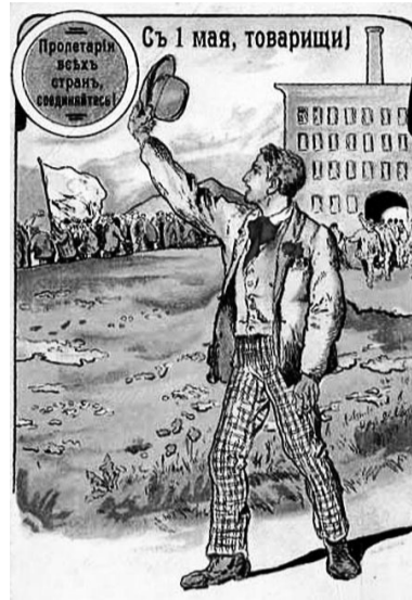
Центральный Комитет КРПБ, Совет партии

Мира, добра, благополучия Вам и вашим семьям, родным и близким. Всего Вам по-весеннему чистого и светлого!