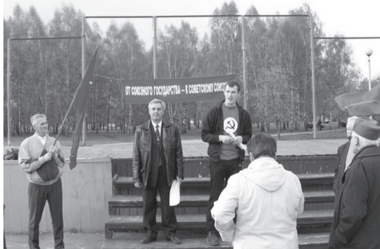
2011: нацболы и БКПТ на пл. Бангалор, среди «тысяч» сторонников

Как стало известно, 8 апреля Верховный суд отклонил жалобу на отказ Минюста в регистрации Белорусской коммунистической партии трудящихся (БКПТ), оргкомитет, которой делает уже пятую попытку влиться в политический бомонд. Проанализировав действия БКПТ, наша газета попыталась выяснить, сколько же коммунистических партий нужно белорусам для полного счастья.