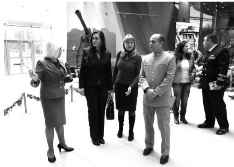
Вице-адмирал Хосе Боггиано посещал музей в прежнем здании на площади Октябрьской в

Отсканируйте этот QR-код, чтобы открыть электронный архив нашей газеты