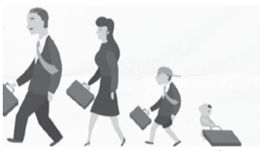
Пресс-служба КПБ по материалам БЕЛТА

ная социальная служба» мы с руководителями местных Советов договорились, что молодежные бизнес-инкубаторы будут созданы в каждом районном центре. Не обязательно такие же масштабные, как в Минске, но они должны быть», - сказал Михаил Мясникович.